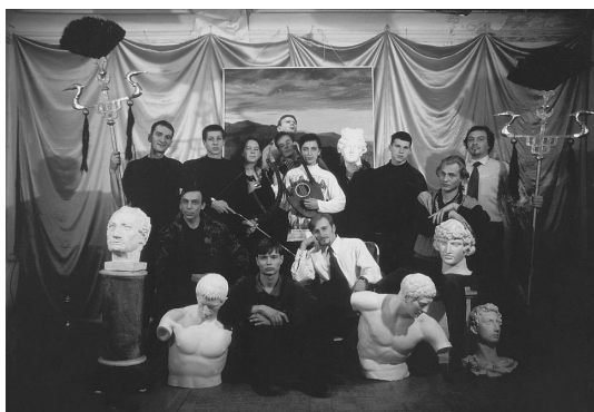
Профессора и студенты Новой Академии на Пушкинской 10. С-Петербург, 1985