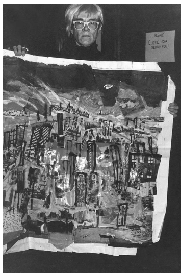
Энди Уорхолл с работой Т.Новикова «Город». Нью-Йорк, 1985.

Времена менялись: 80-е годы сменились 90-ми годами, и я уже тогда чувствовал, что пора заняться чем-то другим, более актуальным и свежим. Какое-то время мы занимались технотворением, организовали первые дискотеки, первые клубы, привезли наших знакомых диджеев из Европы и Америки. С таким диджеем, как Вестбам, мы познакомимся еще в 1986 году в Риге и привезли его в начале 90-х в Петербург, что тогда было крайне революционным жестом. Постепенно и это все стало нам надоедать. Пафос деятельности в массовой культуре благодаря ее победе стал пропадать. Мы поняли, что, за что боролись, на то и напоролись: появились коммерческие версии «Новых художников», сотни художников стали работать в такой же манере, возникло огромное количество клуб-промоутеров, дискотеки стали массовым явлением, а не уникальным элементом культуры. Тогда после заграничного путешествия я пришел к выводу, что пора резко изменить направленность. Еще в ранние годы, когда я заполнял анкету при поступлении в Русский музей, в список любимых художников я поставил имена Леонардо да Винчи и Рафаэля. Меня всегда интересовало классическое искусство. В 1990-е годы я стал ощущать всю прелесть классики, и в 1988 году мы начали организовывать нашу Новую академию. Тогда появилась первая волна консерватизма. В 1989 году мы образовали на основе старой организации времен «Новых художников» – Новой академии всяческих искусств – Новую академию изящных искусств.