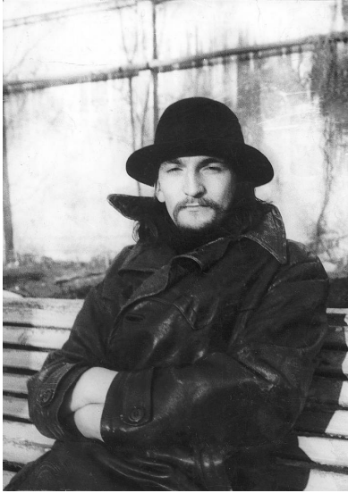
Тимур Новиков.1978.

Моя жизнь началась 24 сентября 1958 года на Литейном проспекте в доме № 60. Собственно туда меня принесли из роддома, который находится в квартале от Литейного, в доме на улице Маяковского, в так называемой Снегиревской больнице. И вот с тех пор уже 40 лет я живу в этом доме. Родившись в центре города Петербурга, я всегда ощущал себя петербуржцем. Конечно же, архитектурные формы Невского проспекта – улица Зодчего Росси, Дворцовая площадь, Русский музей – влияли на становление моей личности, на мое восприятие мира. Одни из первых моих воспоминаний – скульптуры на павильонах у Аничкова дворца и походы в Елисеевский магазин, который меня крайне поражал своим зданием. Первые же мои художественные впечатления связаны с Русским музеем. Там меня восхищал огромный зал с «Последним днем Помпеи», «Фриной» и другими шедеврами живописи, удивлявшими своим масштабом и яркостью. К окончанию детского сада и переходу в школьный возраст я уже ощутил себя художником. И в дальнейшем никогда не сомневался в своем призвании. Был, конечно, период лет в 13, когда я чувствовал себя еще и авиатором. Но когда я чувствовал себя авиатором, я, собственно, был как бы летающим художником, как Сент-Экзюпери был летающим писателем.