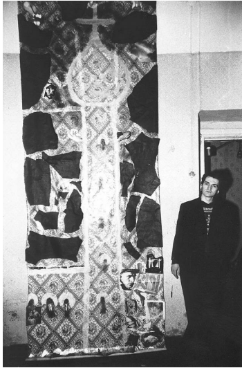
Т.Новиков. Колокольня Ивана Великого. Галерея «АССА». 1985.