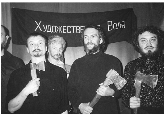
Активисты «Художественной воли». 1998.

соответствует физическому облику новиковского произведения: значок/герой сжимается до тех самых минимальных % относительно общей площади полотна, став крестиком на ткани 19 . Так, боец у-шу бьет в конкретную точку, или сложная машина приводится в движение нажатием маленькой кнопки. Небольшое, но точное, сконцентрированное усилие приводит в динамику грандиозные массы. Новиков развивал и форсировал традиционный петербургский минимализм, истоки которого можно возводить к богдановскому энергетизму эпохи футуристов, Даниилу Хармсу, кругу арефьевцев, Олегу Григорьеву и Валерию Черкасову 20 . Эта традиция понималась как делание максимально эффективных и красивых жестов с минимальной затратой энергии. То есть эти художественные жесты должны были быть не подражательны, а уникальны в своей точной выверенности, что собственно и следует называть творчеством. Понимание в местной традиции искусства как традиции чести, вне отрыва от повседневного проживания, переносило принцип минимализма в самые разнообразные сферы жизни художника. Все совершенное и правильное создается практически из ничего и само собой; материал и техника изобретаются на ходу; художник действует вслепую. Из ничего делались произведения и события. Использование того, что есть под рукой, внешне было продиктовано обычной суровостью быта. Тем не менее это не были картонные баррикады. Фокус не может быть чудом: чудо – это мир в самой своей обыденности, это то, что просто происходит (для тех, кто не смотрит, а видит).