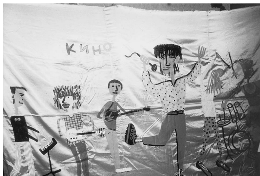
Т.Новиков. Сценография для концерта группы «Кино».1985

Подобный поиск шел и в направлении новых культурных явлений. Это был период повального увлечения независимой рок-музыкой, столицей которой стал Ленинград. Тимур становится художником самой популярной и модной группы «Кино».